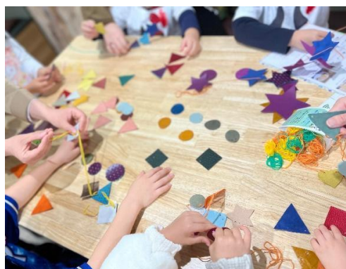
画像：「幸せのガーランドで街を飾ろう！ワークショップ」(6日)