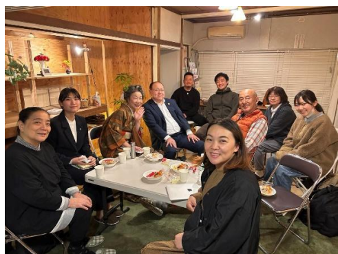
画像：過去の「ひとつなぎトーク」の様子(6日)